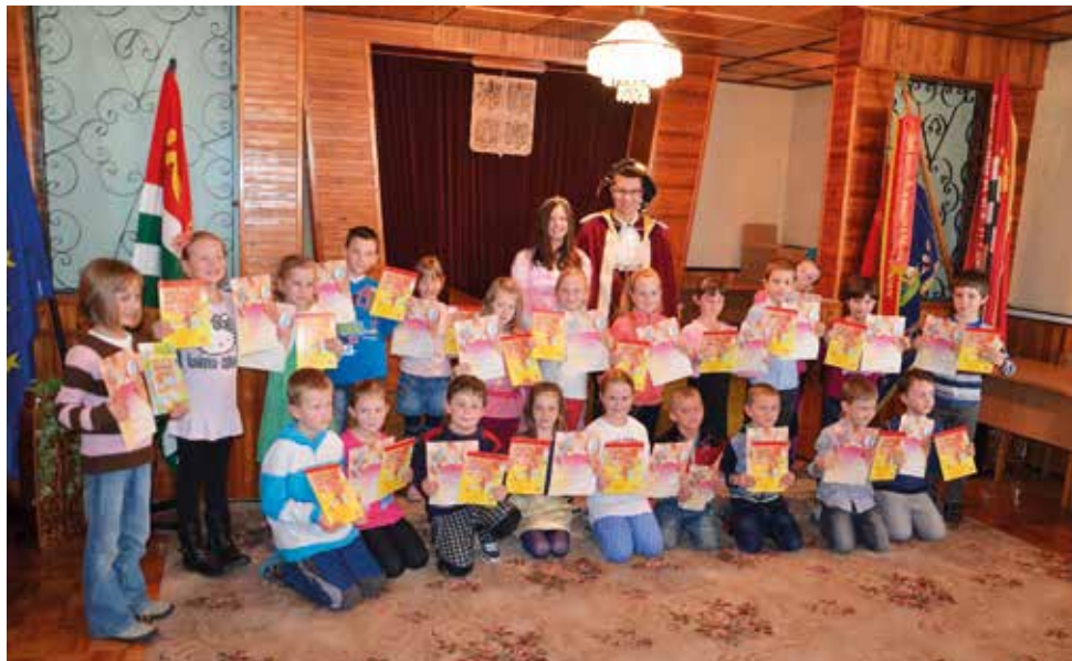
Pasování prvňáčků na čtenáře.

Letošního, již šestnáctého, ročníku Noci s Andersenem, která konala 1. dubna, se účastnilo i 14 třetáčků naší školy. Hans Christian Andersen (se narodil 2. dubna 1805) byl dánský spisovatel, který proslul především jako jeden z největších světových pohádkářů.