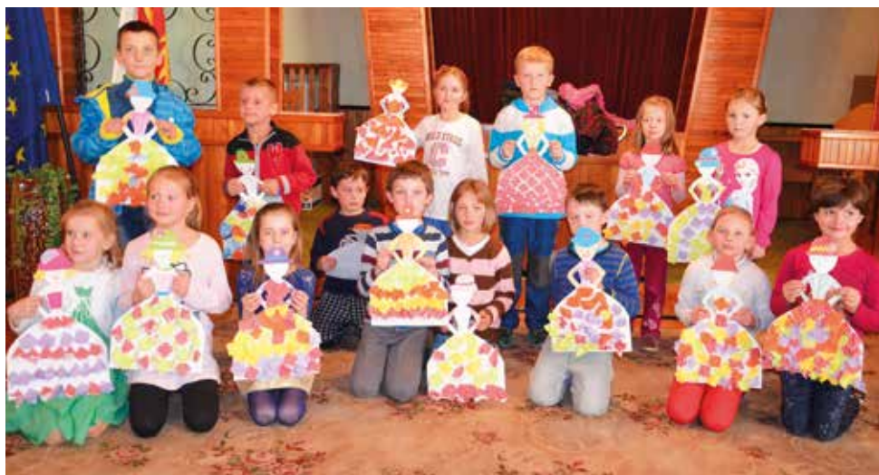
Vyrábění v místní knihovně.